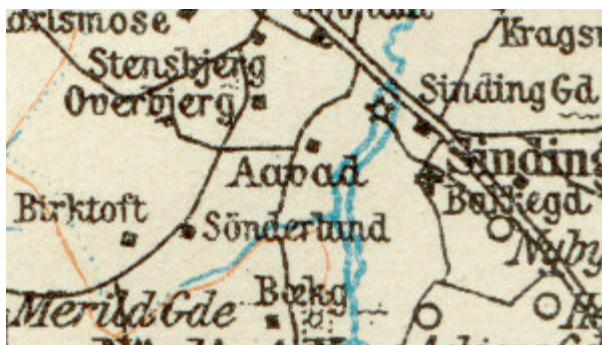
Birktoft ses her overfor Sønderlund. Sinding Mølle ligger til venstre for Sindinggård. Den er vist med en ring med fem streger ud fra.